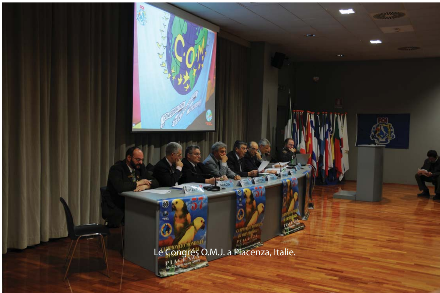
Le Congrès O.M.J. a Piacenza, Italie.